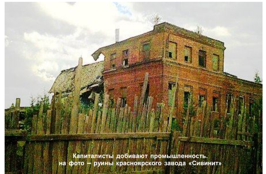
Капиталисты добивают промышленность. на фото - руины красноярского завода «Свинит»

ОРЛОВСКИЙ завод «НаучПрибор» прекратил свою работу в начале августа. Сотрудники в середине рабочего дня без объяснения попросили покинуть территорию завода, вручив уведомления о закрытии цеха в Орле и его переносе в Санкт-Петербург. «Нас вывели как собак на улицу и заставили на колене какие-то документы подписывать. С металлоискателями людей обыскивали, боялись, что мы станки разберем. Но вопрос не в этом, производству по-любому кирдык. А где мне работу найти? Работать негде», — рассказал один из рабочих. Следует отметить, что за последние годы Орел потерял несколько промышленных предприятий: со скандалами и долгами по зарплате. Индекс промышленного производства в регионе стабильно падает, а по уровню безработицы (по данным Росстата) в середине 2018 года Орловская область занимает печальное первое место среди регионов ЦФО.