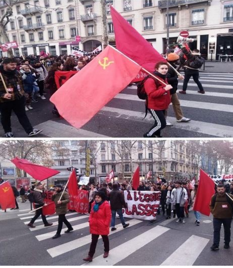
Фото с комментарием опубликованы в сообществе социальной сети Вконтакте «Союз советских офицеров и всех, верных СССР» https://vk.com/cco_cccp

читайте, распечатывайте, распространяйте!