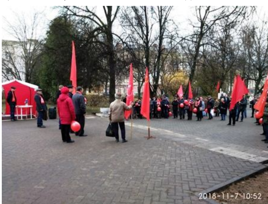
Фото совместного мероприятия в честь Великого Октября, прошедшего 7 ноября в г. Великие Луки. Участники – КПРФ, НПСР, ВКП(б).

Челябинский ОК ВКП(б) 8 ноября 2018 года