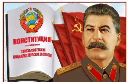
Конституция СССР является единственной в мире до конца демократической конституцией. И.В.Сталин

Правильное распределение ресурсов позволило не только развивать ВПК, но и гражданскую экономику страны, направленную на повышение благосостояния народа. Это позволило уже в 1949 года провести первое снижение розничных цен, которое продолжалось до 1954 года, пока сталинскую экономику не начали сворачивать.