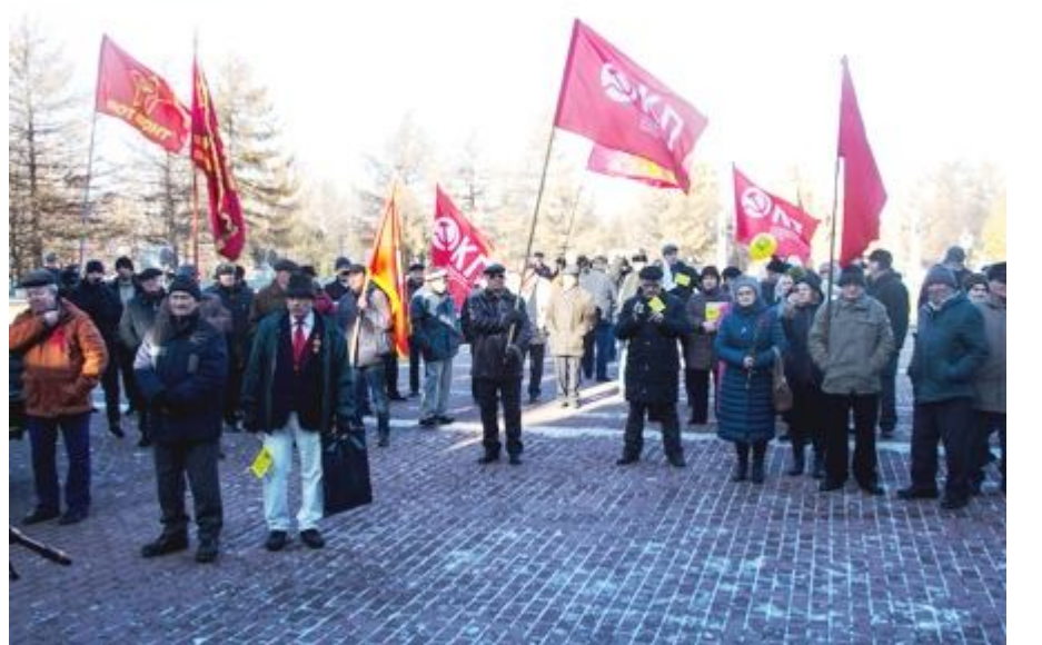
7 ноября в Челябинске продолжились мероприятия, посвященные Столетию Великого Октября. Днём большевики возложили цветы к обелиску на «Братской могиле большевиков, погибших в борьбе за Советскую власть в г. Челябинске».

В ходе митинга активистами Челябинской организации ВКПБ(р) распространялись листовки и газеты, проводилась агитационная и пропагандистская работа.