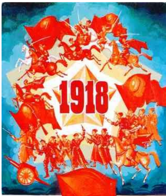
«ЭТИХ ЛЕТ НЕ СМОЛКНЕТ СЛАВА, НЕ ПОМЕРКНЕТ НИКОГДА».

История Красной Армии неразрывно связана с историей Советского государства. Молодое Советское государство диктатуры пролетариата, созданное Великой Октябрьской социалистической революцией в 1917 году, столетнюю годовщину которой отметили недавно трудящиеся всего мира, было вынуждено защищаться не только от сил внутренней контрреволюции. Его опаснейшим врагом явился международный империализм. Враждебные действия империалистических держав начались уже в начале 1918 года. На Владивостокском рейде появились японские и американские военные корабли. Все более усиливалась подготовка широкого наступления на Советскую Россию немцами и австро-венгерскими войсками. В декабре 1917 года Англия и Франция, поощряемые США, заключили тайное соглашение об организации военных действий против Советской России. Ударной силой Антанты стал имевший оружие и находившийся на территории России Чехословацкий корпус. 15 января 1918 года он был напрямую подчинён французскому главнокомандованию. Оценивая обстановку сложившуюся в начале 1918 года, В. И. Ленин отмечал, что «от сплошного триумфального шествия в октябре, ноябре, декабре на нашем внутреннем фронте, против врагов Советской власти нам предстоит перейти к стычке с настоящим международным империализмом в его настоящем враждебном отношении к нам».